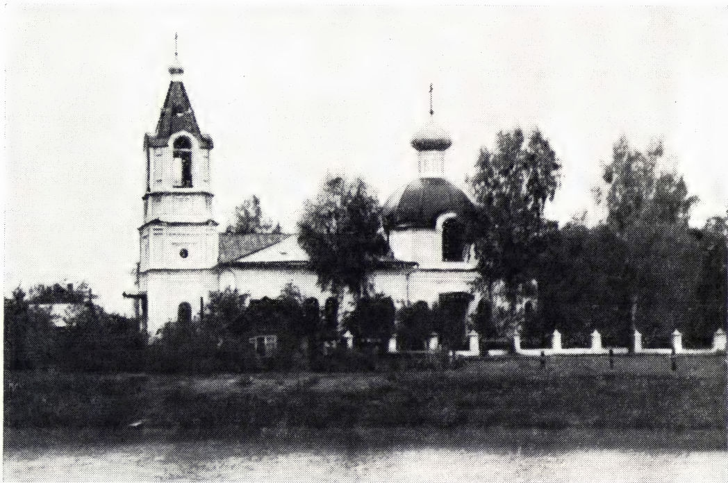
Свято-Троицкий храм в с. Турбичево Московской епархии